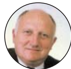
Hynek Strnad 1. viceprezident

V roce 2001 dosáhl export agrárních komodit výše 37,7 mld. korun. Největší objem exportu pak byl realizován ve skupině ostatních potravinářských výrob (převážně se jedná o cukrovinky) a zpracování mléka (mléčné konzervy, máslo a sýry). Exportní výkonnost odvětví představující cca 16,1 % tržeb je však jedna z nejnižších ve zpracovatelském průmyslu a vyplývá především z tradiční velmi silné orientace potravinářského průmyslu na tuzemský trh (z toho export zpracovaných výrobků 17 mld. korun, tj. 43,1% celkového agrárního exportu). Nízká exportní efektivita potravinářského průmyslu je pak ještě umocňována nízkým podílem zpracovaných výrobků na celkovém vývozu. Na straně dovozů se pak na jejich výši významně podílí především produkty a suroviny tropického a subtropického pásma (káva, čaj, koření, kakao). Varující je však stejně jako v roce 2000 další nárůst dovozu produkce výrobků z oblasti mírného pásma, a to i zahrnující tradiční české zemědělské a potravinářské