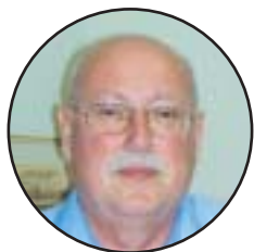
Jaroslav Camplík prezident

Rok 2002 znamenal přelom v činnosti PK ČR, a to nejen proto, že k 31. 12. 2002 nabyla účinnosti novela zákona č. 110/97 Sb. o potravinách, a komora se tak stala zákonným reprezentantem českého potravinářského průmyslu, ale zejména proto, že byla dobudována funkční, akceschopná struktura, a to nejen vnitřní organizace komory, ale zejména jejich vazeb na potravinářský průmysl, státní správu a další organizace reprezentující zájmy jednotlivých sektorů v České republice i mimo ni.